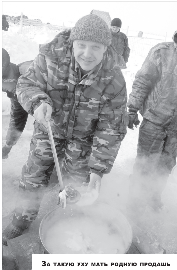
За такую уху мать родную продашь