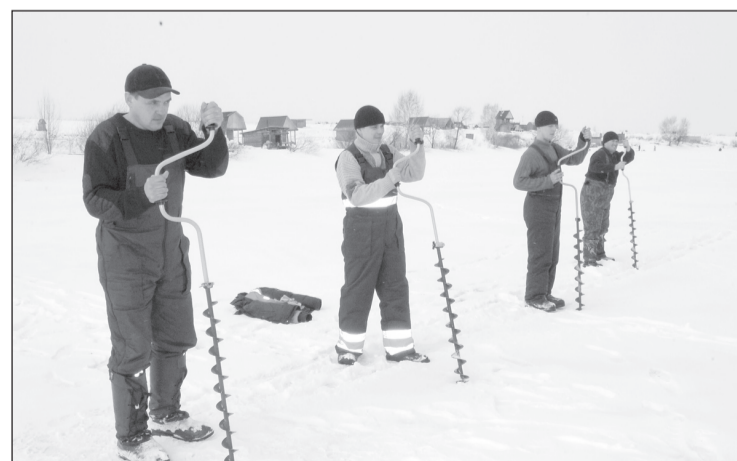
С ледобуром дружить – с рыбой быть